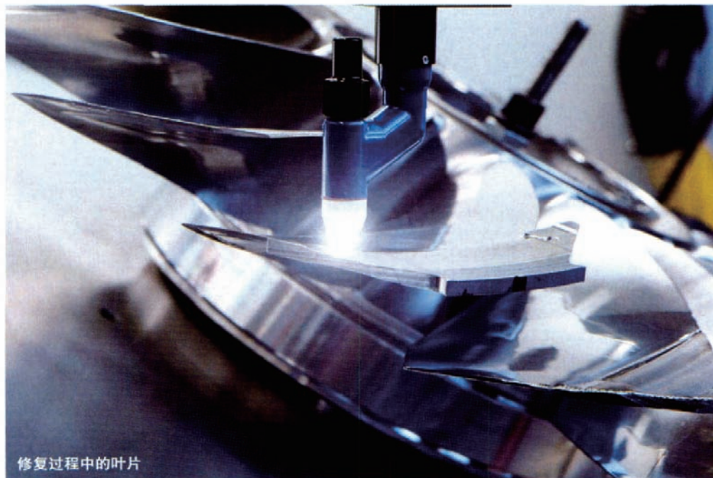
修复过程中的叶片

在重构待修复区域的模型之后,建立重构模型与叶片理论模型之间的映射关系,并根据该关系将理论模型的加工代码进行自动变换,以用于重构模型的加工。这种自动变换不